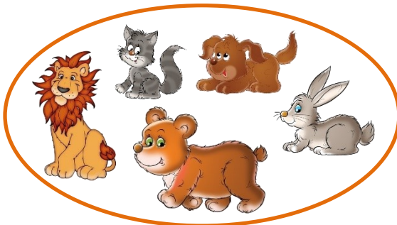
Animais com pelos