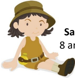
Sara 8 anos